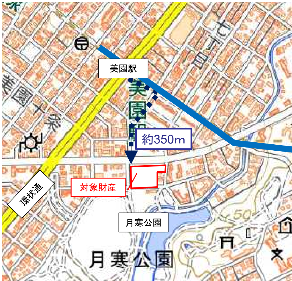
「地図データ」(国土地理院 http://maps.gsi.go.jp/ )をもとに北海道財務局作成