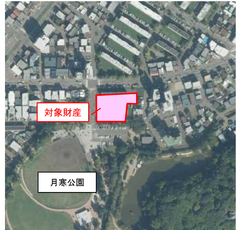
空中写真データ(国土地理院 http://maps.gsi.go.jp/ )をもとに北海道財務局作成