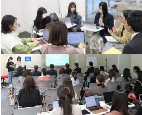
アクティブラーニングの様子

東海財務局は、金城学院大学や関係機関と連携し、大学生に対する「金融リテラシー向上のための実践的アクティブラーニング」の取組を実施いたしました。