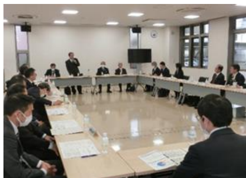
商工団体、金融機関等との会合

静岡財務事務所では、地域における事業者支援態勢の実行状況を把握するため、地域金融機関のほか、地方公共団体、商工団体、企業等との対話を実施しています。