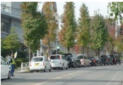
ハローワーク周辺道路の渋滞

東海財務局は、国有財産の売却等を通じて財政に貢献するとともに、地域や社会のニーズに対応した有効活用を促進することを目的に、国有財産監査を実施しています。