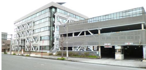
沼津合同庁舎と立体駐車場

沼津出張所は、駿東伊豆消防組合と「災害時の沼津合同庁舎立体駐車場の使用に関する覚書」を締結いたしました。