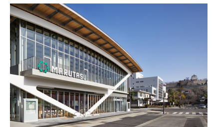
【市民交流活動センター】