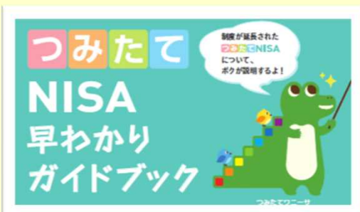
【つみたてNISAパンフレット】