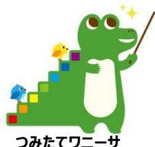
つみたてワニーサ