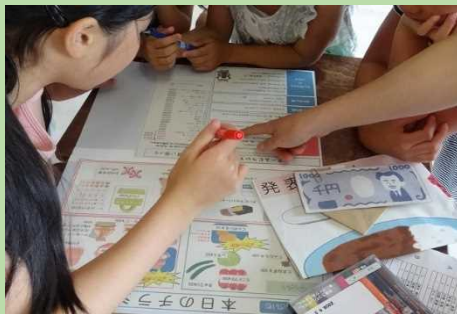
お買い物ゲームをやってみよう！