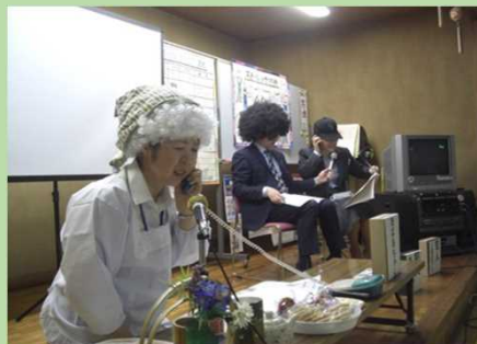
うまい話にご用心！（寸劇）