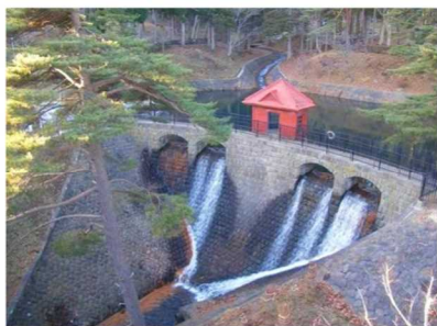
むつ市 水源池公園敷地の一部 （無償貸付）