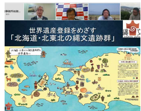
青函みらい会議の様子

令和3年度からは、多くの方にも参加していただけるように、有識者による基調講演やパネルディスカッション等をオンラインで配信する「青函みらい会議」を開催しております。