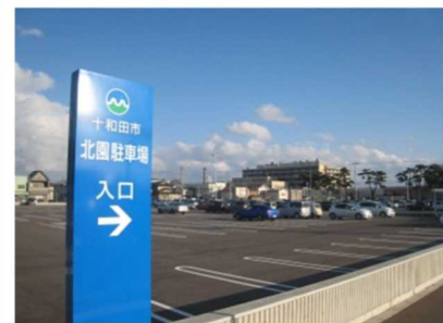
十和田市 北園駐車場敷地 （売払）