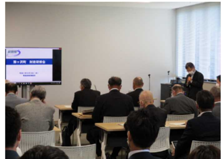
地方財政研修会風景

公共施設の維持管理費増大への危惧に加え、新型コロナウイルス感染症への対応による財政出動など、財政上の諸課題に直面している地方公共団体に「地方財政研修会」を通じたサポートに取り組んでいます。