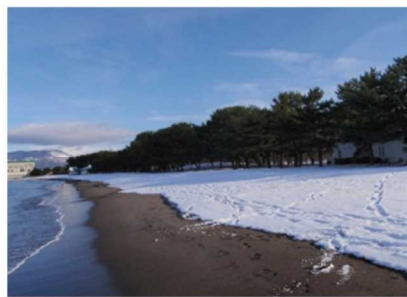
青森市 合浦公園敷地の一部 （無償貸付）