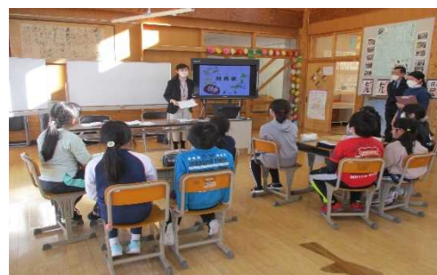
金融経済教育講座風景

小・中学生、高校生等を対象に、将来のお金に関わるトラブル防止や多重債務者発生未然防止のため、金融に関する基礎知識と判断力が身につく「金融経済教育講座」を実施しています。