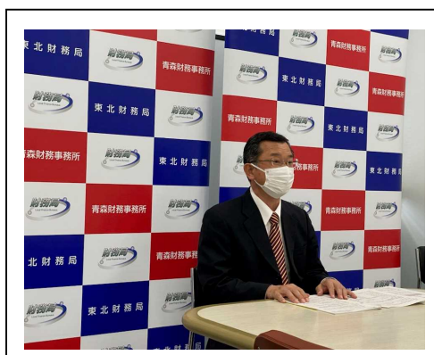
県内経済情勢報告記者発表

これらの調査結果は財務省の財政政策等の立案に役立てているほか、「県内経済情勢報告」や「法人企業景気予測調査」として、定期的に公表し、地域の皆さんに広くご利用いただいています。