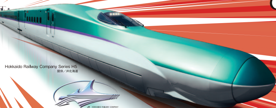
Hokkaido Railway Company Series H5