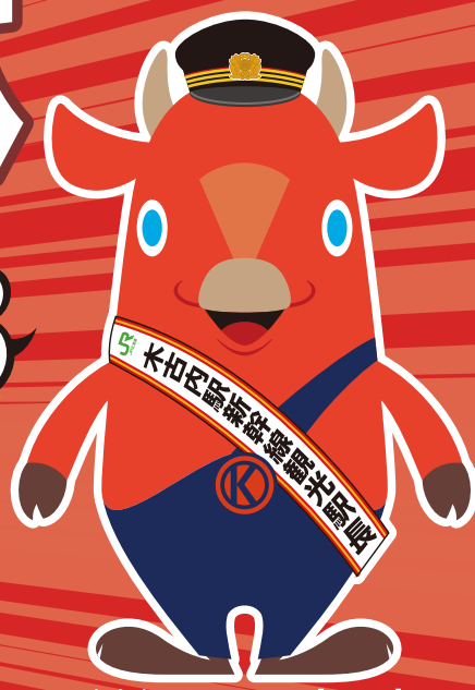
木古内町キャラクター【キーク】