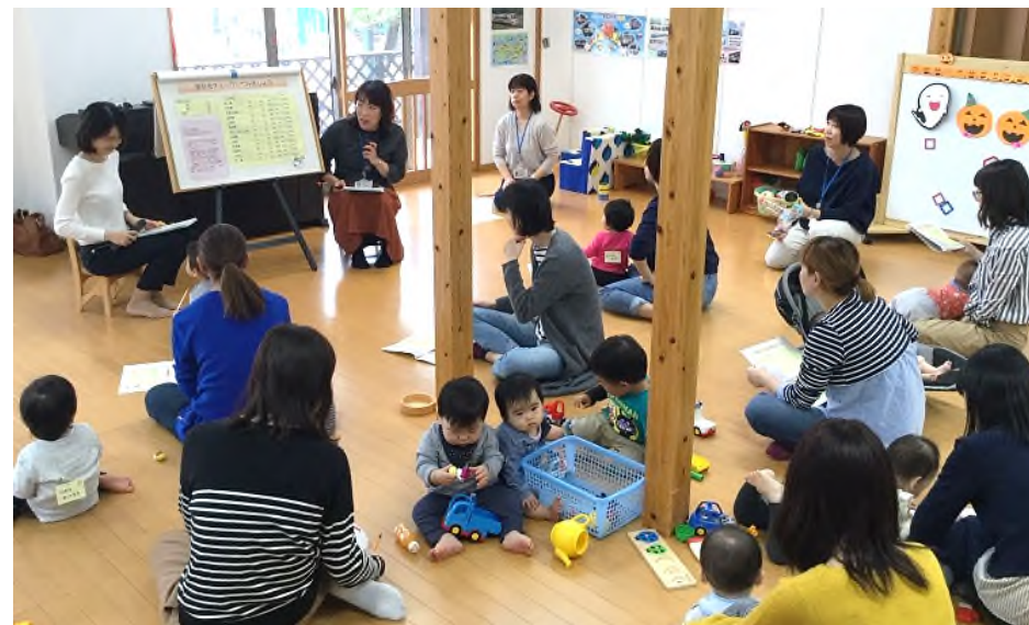
2018年10月31日（水）高松市中野保育所子育て支援センター「めだかのがっこう」での様子

四国財務局では、子育て支援の一環として、子育て支援センター、子育て広場、図書館などにお伺いして、出前講座・座談会を行っています。