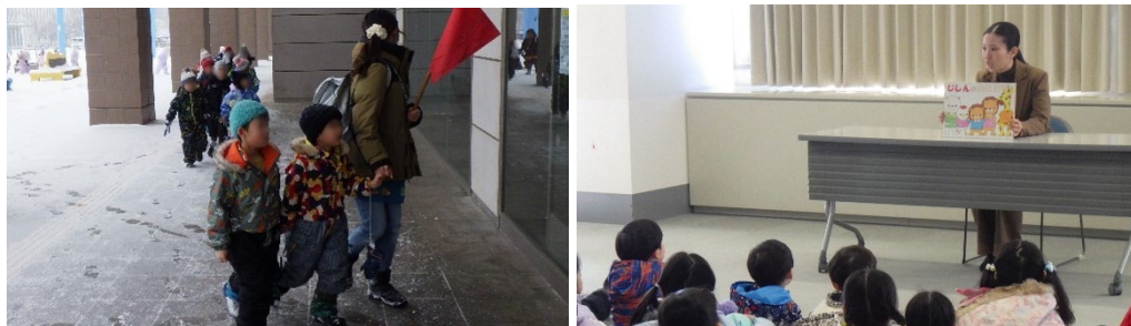
【冬期園児向け避難訓練・職員による防災紙芝居】