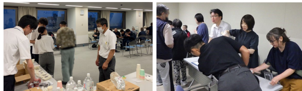
【避難されている地域住民への対応・避難者への食料配付】