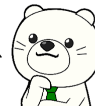
大洲市移住お試し住宅