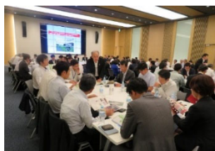
プラットフォームの官民対話

道路や公園等の包括的民間委託を検討する同町に対し、PPP/PFIプラットフォームへの参加を提案。 民間事業者への効果的な周知 等を支援。