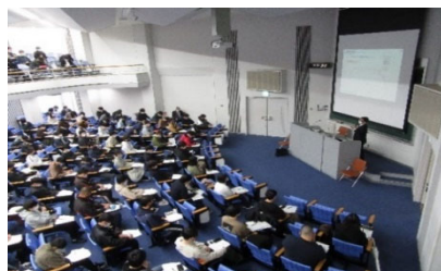
金沢学院大学での寄附講義