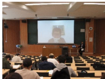
コロナ禍でのリモート形式の講義