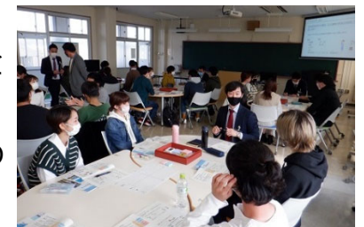
【大学でのアクティブラーニング型授業】