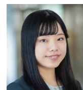
大道 葵子 財務省 大臣官房地方課