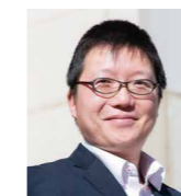
室 徳圭 財務省 理財局 国有財産業務課 国有財産業務指導官