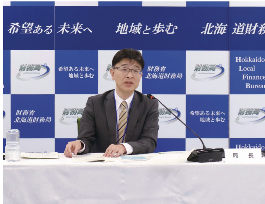
管内の経済情勢についての記者発表