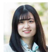
山西 雛歌 金融庁 企画市場局 市場課取引所企画係長