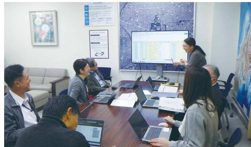
管財部の業務改革・デジタル化に向け、現場からのアイデアと向き合い議論をしている様子

国有財産行政の最前線は「現場（財務局）」にあります。財務局は地域と顔の見える距離感で仕事をするやりがいのある職場です。地域社会の課題には多様なものがあります。それらの解決に向けて、従来から行われている手法のみではなく、最適利用に向けた柔軟な発想が求められています。志の高い皆さんの挑戦をお待ちしています。