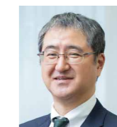
大城 健司 金融庁 総合政策局 参事官 (モニタリング担当)