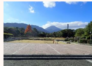
別府公園 (別府市に無償貸付)