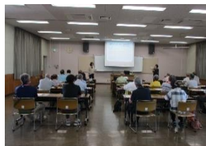
高齢者向け講座の様子