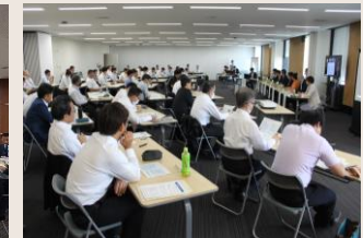
事業者支援等に関するシンポジウム