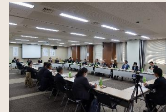
くまもと活性化フォーラム

財政・経済調査・国有財産・金融等の業務を通じて、地域の課題やニーズを把握し課題解決を支援することで、地域貢献に努めています。