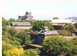
熊本城公園 (熊本市に無償貸付)

このほか、地方公共団体と連携し、庁舎や宿舍を避難場所や防災訓練の場として提供するなど、防災目的での活用も進めています。