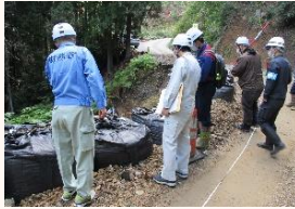
災害査定立会の様子

台風・豪雨等により、河川・道路・学校等の公共施設や農地・農業用施設等が被害を受けたときは、早期に復旧し、住民生活の安定を図るため、現地に向いて災害復旧費用を決定しています。