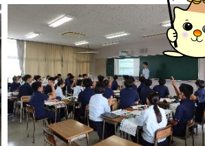
財政教育プログラムの様子