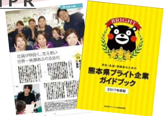
ガイドブックの作成・配布