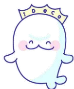
iDeCo普及推進キャラクター 「イデコちゃん」

この講座は、財政や金融の所管官庁である財務省近畿財務局が、地域の皆様に経済や財政、お金の知識・判断力（金融リテラシー）を身に付けていただくことを目的として実施しているものです。