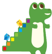
つみたてNISAキャラクター 「つみたてニーサ」