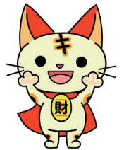
近畿財務局マスコット Kinki CATs

FAXでお申込みの方は必要事項をご記入の上、下記FAX番号までこの紙を送信してください。お申込み頂いた方には、後日参加証をお送りします。当日お越しの際に受付へお持ちください。また、定員(150名)になり次第、募集を締め切らせていただきます。