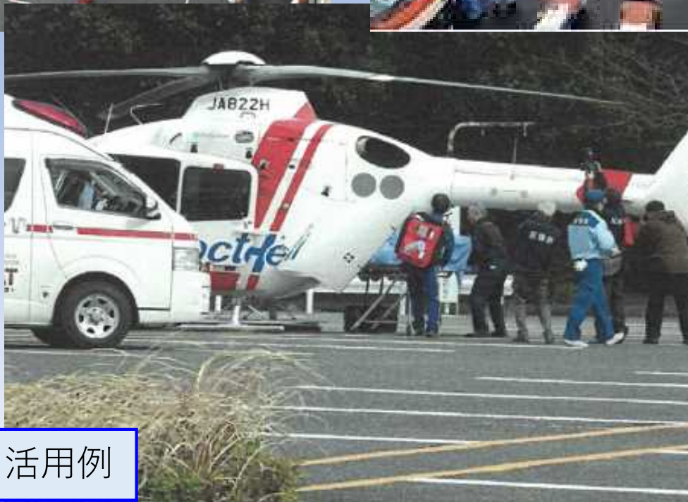
ヘリポート活用例