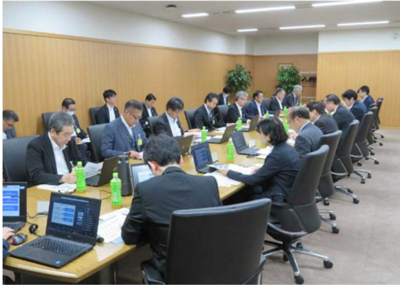
WEB 配信会場(対面出席者)