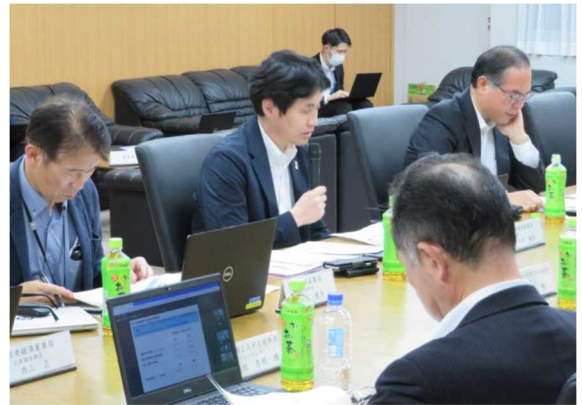
太田・関東経済産業局長による説明