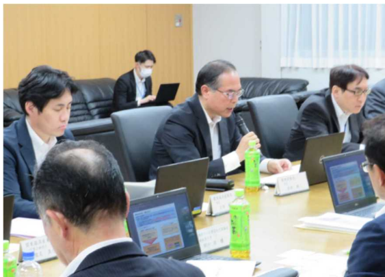
成田・関東財務局長による説明