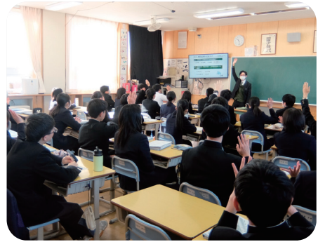
財政教育プログラム

地方公共団体、商工団体、金融機関、支援機関、地域住民、企業など地域の様々な方々や中央の機関等と連携を図りながら、地域のニーズ把握に努め、地域の活性化や課題の解決に向けた取り組みを行っています。