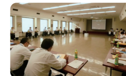
事業者支援に関する意見交換会

県内に所在する地域銀行、信用金庫、信用組合などの地域金融機関が将来にわたる健全性を確保し、預金・融資・決済等の業務を適切に行うよう監督を行っているほか、新型コロナウイルス感染症の影響を受けた地域企業等に対する経営改善支援や事業再生支援等に向け、地域金融機関と深度ある対話を行っています。