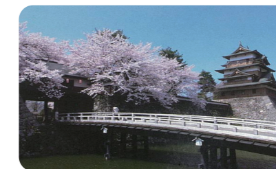
諏訪市に対して無償貸付中の高島公園

このほか、機能を喪失した旧里道や水路等を隣接土地所有者へ売却するなどしています。