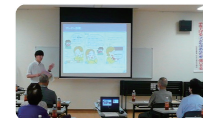
詐欺被害防止に関する講演

金融知識の普及を目的として、小学生から高齢者まで幅広い世代を対象に金融経済教育を行っているほか、未公開株や社債、ファンドへの投資を騙った投資詐欺や電話による詐欺被害の防止に向けた注意喚起活動を行っています。