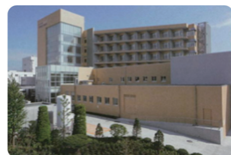
財政融資資金を活用して整備された 浅間総合病院（佐久市）

また、台風などにより災害が発生した場合にも、復旧が円滑に行われるよう資金の貸付けを行っています。