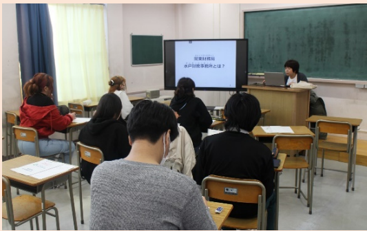
高校生向け金融経済教育講義