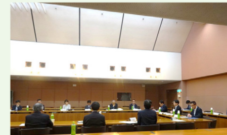
事業者支援に関する意見交換会の様子

また、人口減少・少子高齢化その他の環境変化に直面する地域経済が持続的発展を目指すにあたり、様々な経営課題を抱える事業者に対して、実情に応じた経営改善・事業再生等の支援が円滑に実施されるよう、地域金融機関や地域の関係者と深度ある対話を行っています。