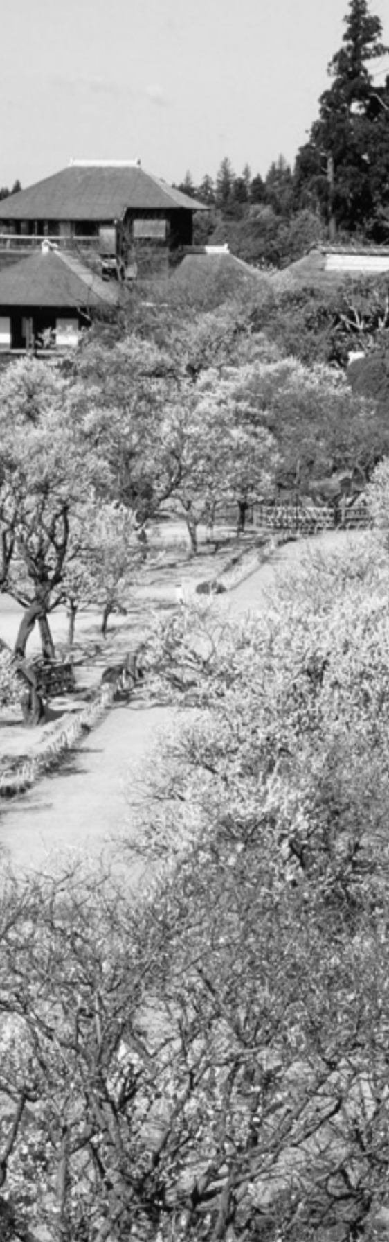
「偕楽園」(水戸市) 公園として茨城県に無償貸付中