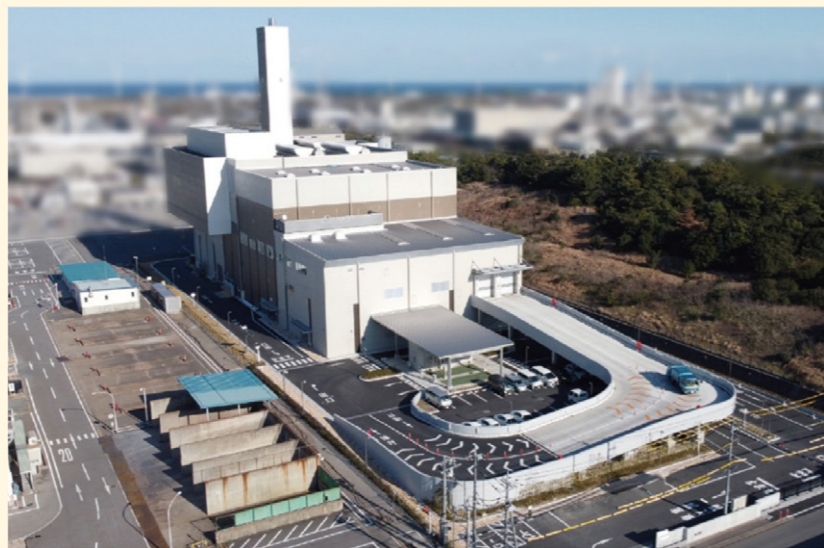
財政融資資金の活用例 鹿島共同可燃ごみクリーンセンター

県や市町村などが、学校、病院、上下水道等の公共施設整備に資金が必要な場合、国が金融市場から調達する「財政融資資金」の貸し付けを行うことにより、豊かで住み良い社会環境づくりに貢献しています。