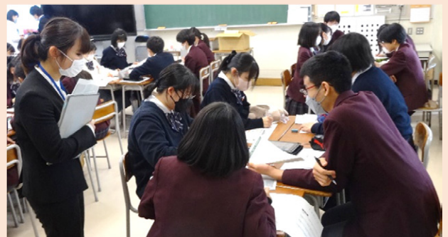
中学生向け財政教育プログラムの実施 (グループワークの様子)

日本の財政に興味を持ってもらい、社会問題を自分事として捉え、自分たちの国の将来について考え、判断できる知識を育むことを目的に実施しているプログラムです。