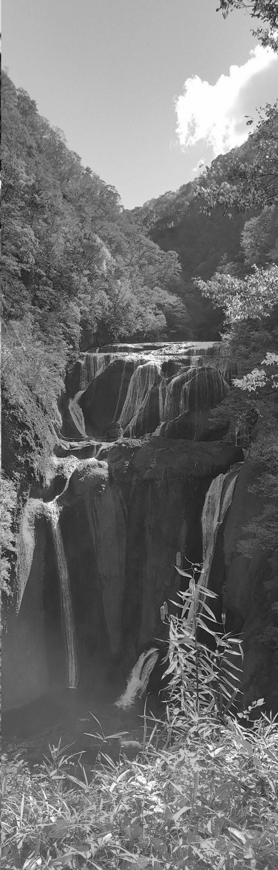
「袋田の滝」(大子町) 観瀑台の建設費に財政融資資金を貸付