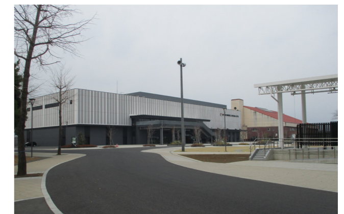
太田市運動公園（太田市）