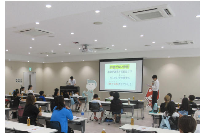
小学生に対し、お金が持つ役割や大切さを説明

理財課は、預金者や投資家等の保護を図るため、銀行や信用金庫、信用組合並びに証券会社、保険会社、貸金業者、プリペイドカード発行業者等が適正な業務運営を行っているかを監督しているほか、金融機関等が事業者を支援する取組みを後押ししています。