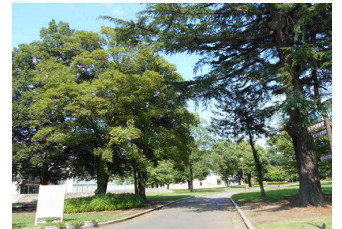
群馬の森公園（高崎市）

一般競争入札には郵便を利用して参加いただけます。入札案内書は、関東財務局ホームページに掲載されているほか、管財課で資料の配付を行っていますので、お気軽に管財課までお問い合わせください。