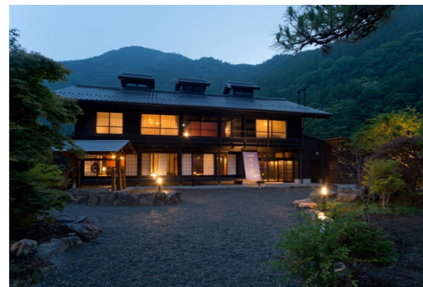
神流町「古民家の宿 川の音」 (財政融資資金の活用事例)

また、群馬県内の経済情勢についての調査や景気の現状、見通しを把握するための調査を継続的に行っています。この調査の結果は、財務省の財政政策などの企画立案に役立てるほか、「県内経済情勢」や「法人企業景気予測調査」として資料の公表を定期的に行っています。