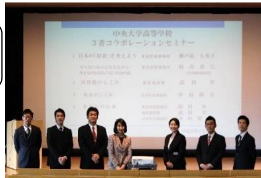
私たちがわかりやすく説明します！