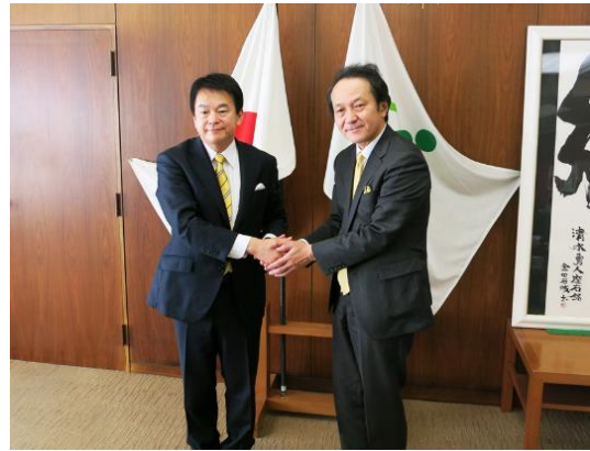
協定締結をおえて握手