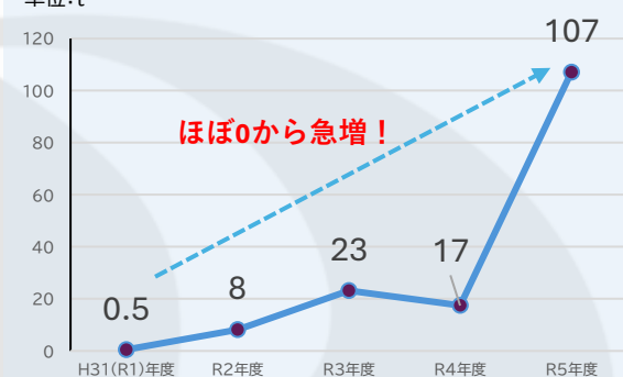
白糠漁協におけるブリの水揚量