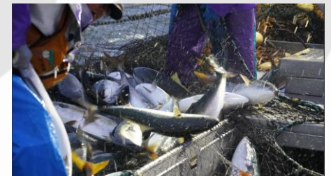
水揚げが急増するブリ