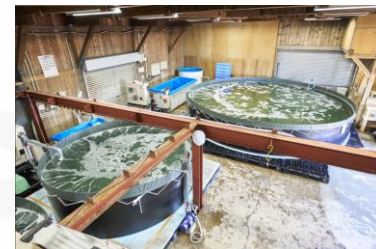
漁協内に設置された鮮度保持水槽