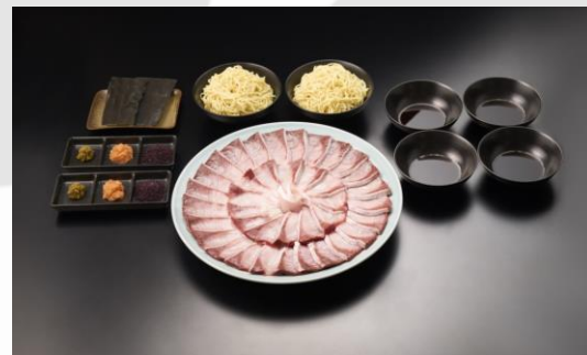
返礼品活用例(ブリしゃぶセット)