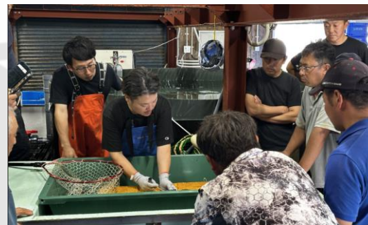
活締め技術勉強会の様子