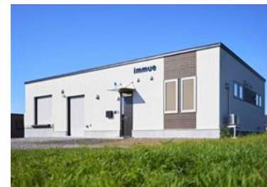
(株)シラリカ水産加工場(R5年設立)