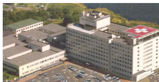
（市立釧路総合病院）