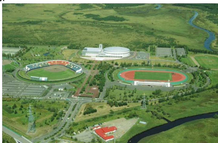
（釧路大規模運動公園）