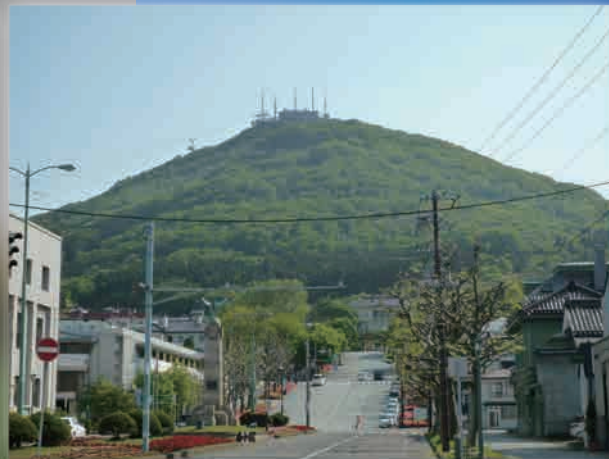
◆函館市に無償貸付中の函館山