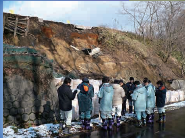
◆災害査定立会の様子