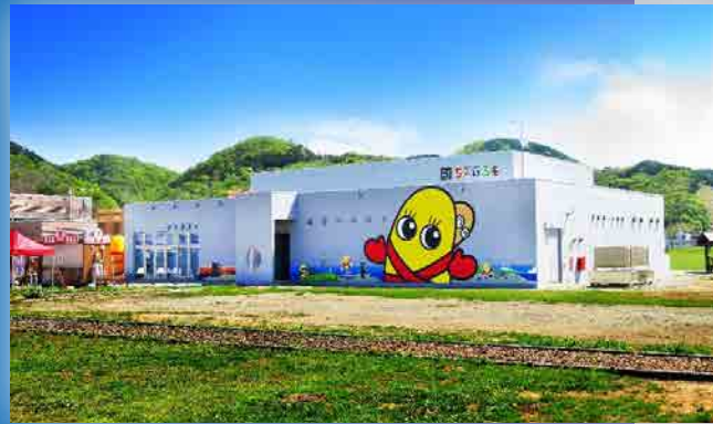
◆留萌市への資金貸付（道の駅るもい）