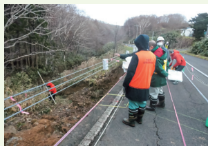
災害査定立会の現場（被災直後）

地震や台風などで道路や河川等の公共的施設が被害を受けた場合、災害現地において被害状況を確認し復旧事業費を決定することで早期の復旧に努め、被災地の生活の安定を図っています。