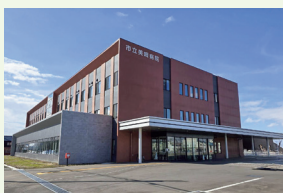
市立美唄病院 / 美唄市 (財政融資資金のうちの過疎対策事業)

また、貸し手としての立場から償還確実性の検証を行うために、直接各地方公共団体に出向き、財務状況や公営企業の経営状況についてのヒアリングを実施しています。