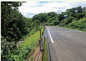
災害査定立会の現場（復旧後）