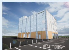
釧路市に売却した国有地に建設予定 の津波避難施設（竣工イメージ）