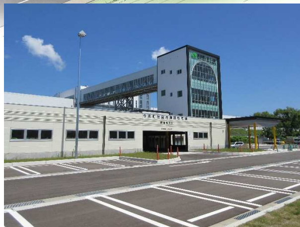
屋内駐車場・屋外駐車場