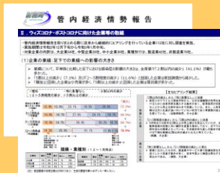
調査結果公表資料

なお、報告した情報・分析結果は、経済財政政策の企画・立案などに役立てられ、調査の結果はHP等で公表しておりますので、福岡・佐賀・長崎の経済情勢を知りたい方は、ぜひご覧ください。