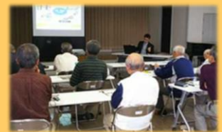
地域の皆様への講演