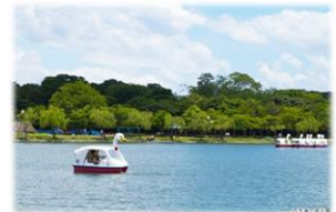
大濠公園（福岡市中央区）

国有財産には、庁舎や宿舍、未利用地等があります。財務局では、庁舎などの総合調整や未利用地の売却などを通じ、地方公共団体と連携しつつ、地域や社会ニーズに対応した国有財産の有効活用を図っています。