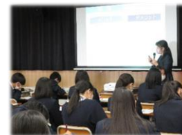
高校での出前講座

経済的に自立し、より良い暮らしを送るために必要な金融リテラシーの向上のため、高校生や大学生に向けた金融経済教育講座等を実施しています。また、金融犯罪被害防止に向け、悪質な投資勧誘・ニセ電話詐欺等に関する注意喚起なども行っています。