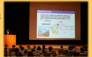
財政に関する授業

以下のような様々なテーマについて、職員を派遣し、地域の皆様に講演や授業を実施しています。オンラインにも対応しています。お気軽にご相談ください。