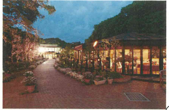
岡垣エリア カフェレストラン