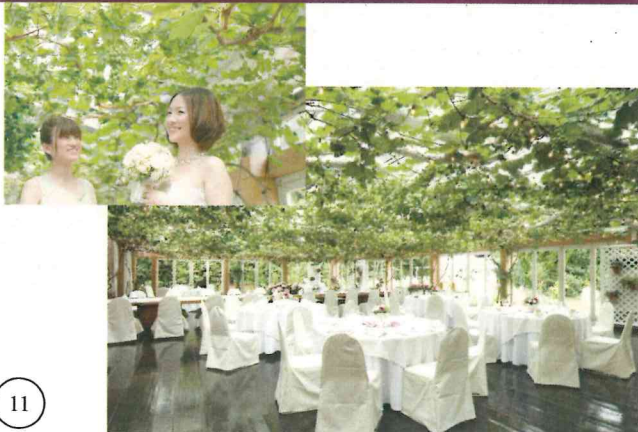
岡垣エリア ゆかいな果樹園