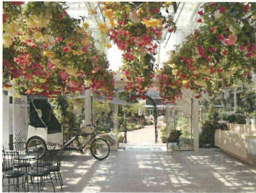
岡垣エリア 花チャペル