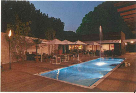
岡垣エリア 森と空のホール