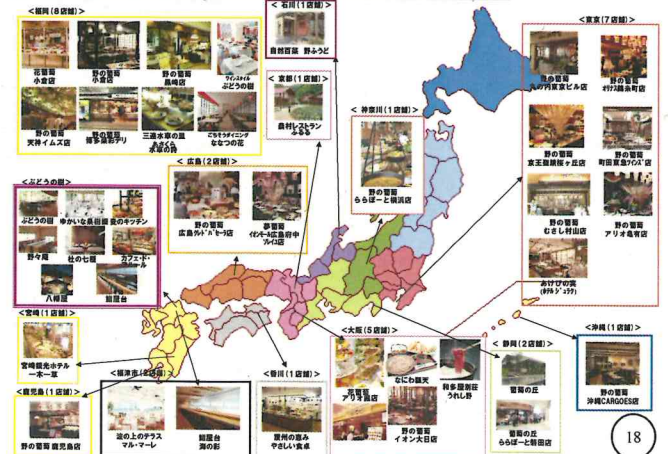
全国に広がるグラノグループ 地産地消の取り組みに多くの企業様より支持頂いております