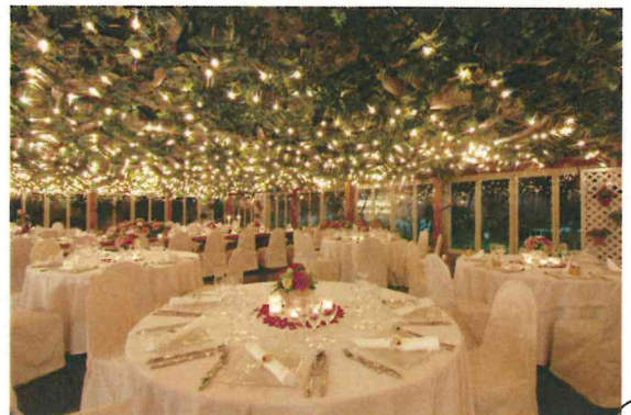
岡垣エリア ゆかいな果樹園