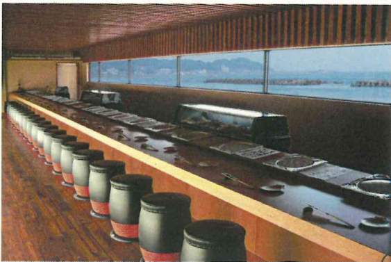
岡垣エリア 鮎屋台