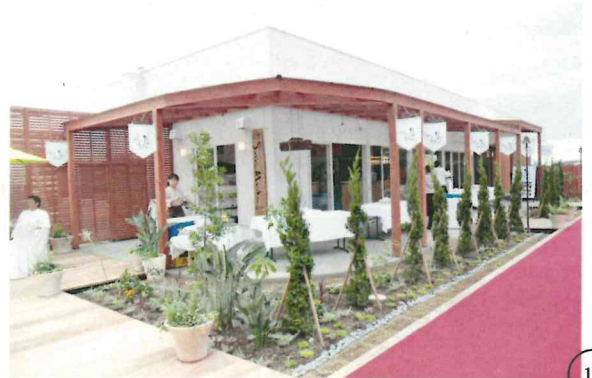
福津エリア 鮎屋台 海の彩