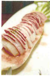
大根のミルフィーユ