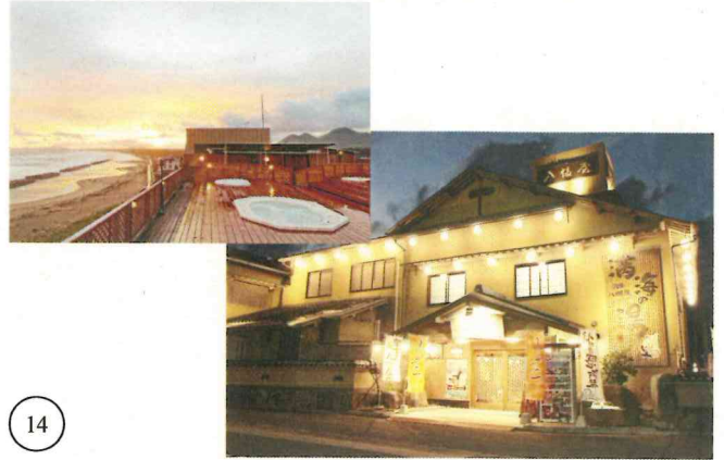
岡垣エリア 八幡屋