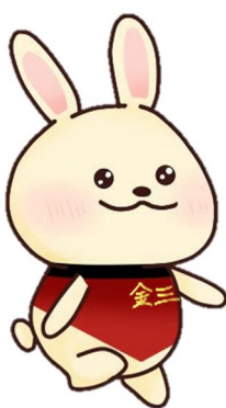
中国財務局金融監督第三課 マスコットキャラクター 「うさぎの金三(きんさん)」

中国財務局では、こうした活動のほか、金融リテラシーの向上に役立つコンテンツとして「なるほど金融講座」を開設、同講座内で「金融トラブル防止ハンドブック」も公開しておりますので、この機会に併せてご覧ください。