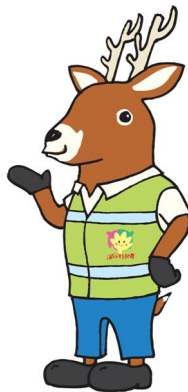
「減らそう犯罪」広島県民総ぐるみ運動 マスコットキャラクター「モシカ」