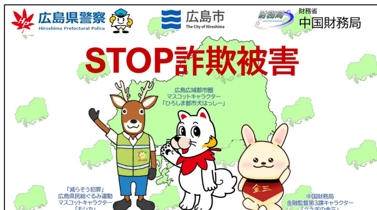
動画イメージ 「STOP 詐欺被害」 (広島市 ver.)

【お問い合わせ先】 中国財務局金融監督第三課 電話 082-221-9221 (代表)