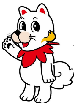
広島広域都市圏 マスコットキャラクター 「ひろしま都市犬はっしー」