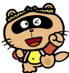
東広島市公認 マスコットキャラクター 「のん太」