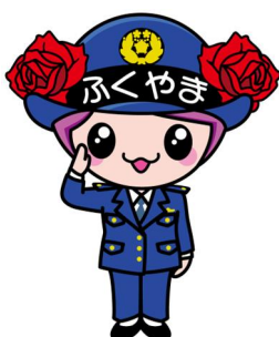
ばらのまち福山 イメージキャラクター 「ローラ」(警官 ver.)