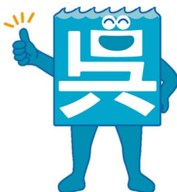
呉市 公式キャラクター 「呉氏」