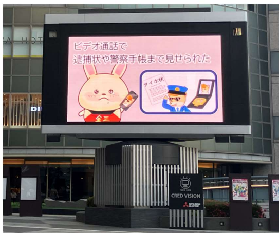
①基町クレドビジョン（広島市中区）

中国財務局は、より多くの市民の皆様に見て、知っていただけるよう県警及び各市と連携しながら、引き続きこうした取組を行ってまいります。