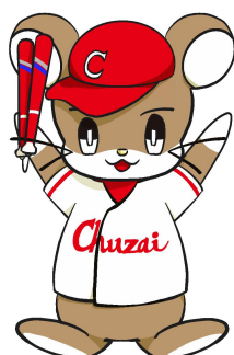
中国財務局のイメージキャラクター