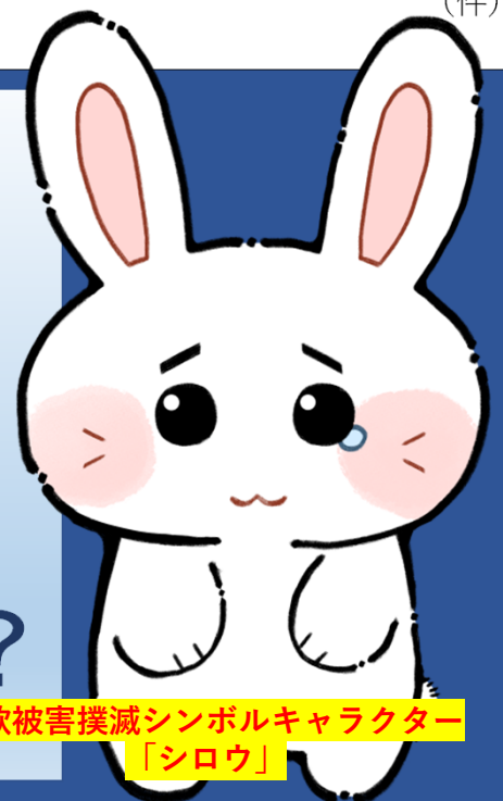
詐欺被害撲滅シンボルキャラクター 「シロウ」