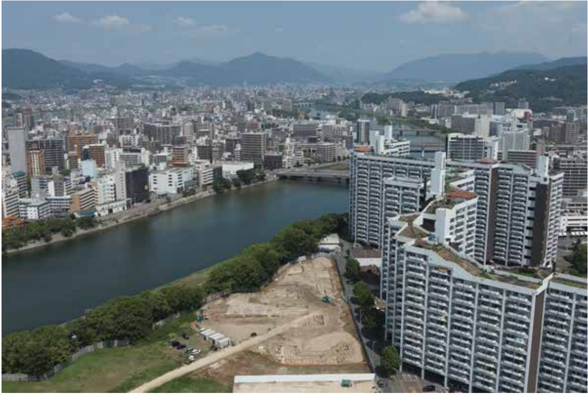
調査区全景（南から）