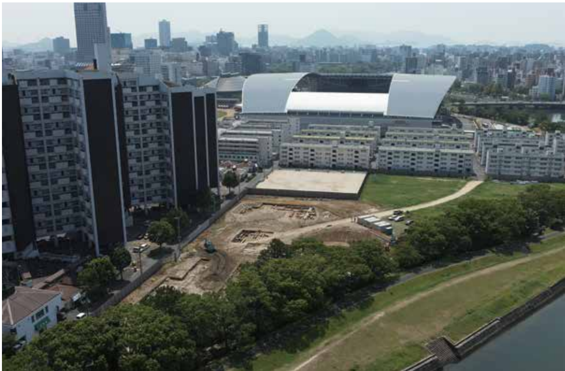
調査区全景（北から）