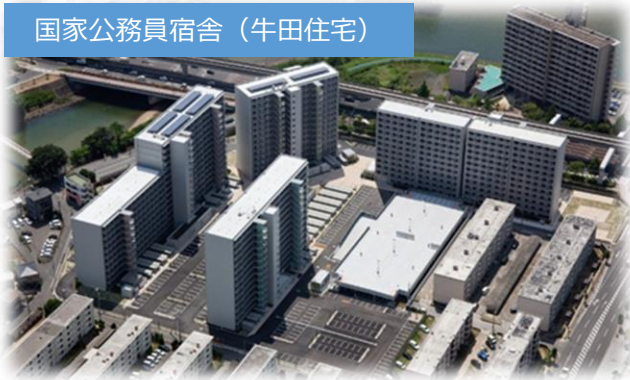
国家公務員宿舎（牛田住宅）