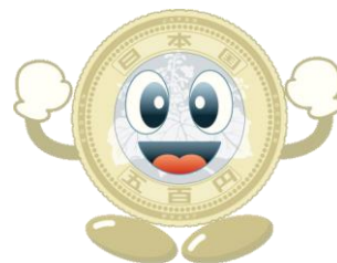
造幣局マスコットキャラクター コインくん