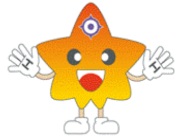
日本銀行広島支店 マスコットキャラクター