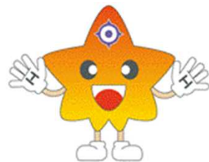
日本銀行広島支店 マスコットキャラクター