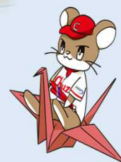
中国財務局マスコットキャラクター ざいちゅう