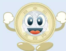
造幣局マスコットキャラクター コインくん