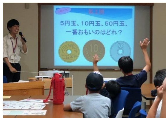
意外と知らない！お金のクイズ