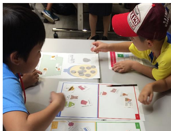
お買いものゲームをやってみよう！