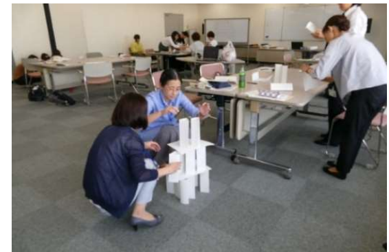
キャリア形成支援研修