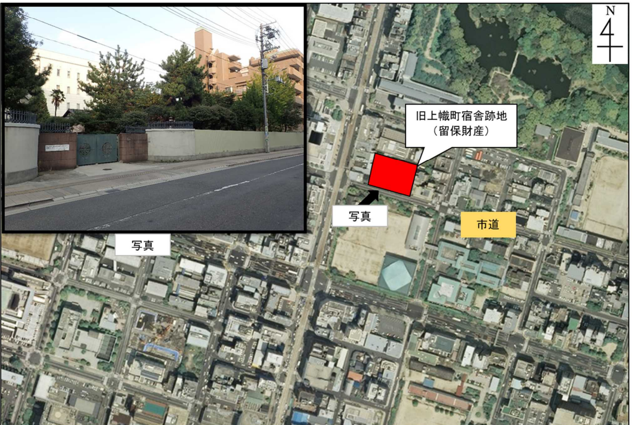
「空中写真データ」(国土地理院HP : http://maps.gsi.go.jp/ )をもとに中国財務局作成