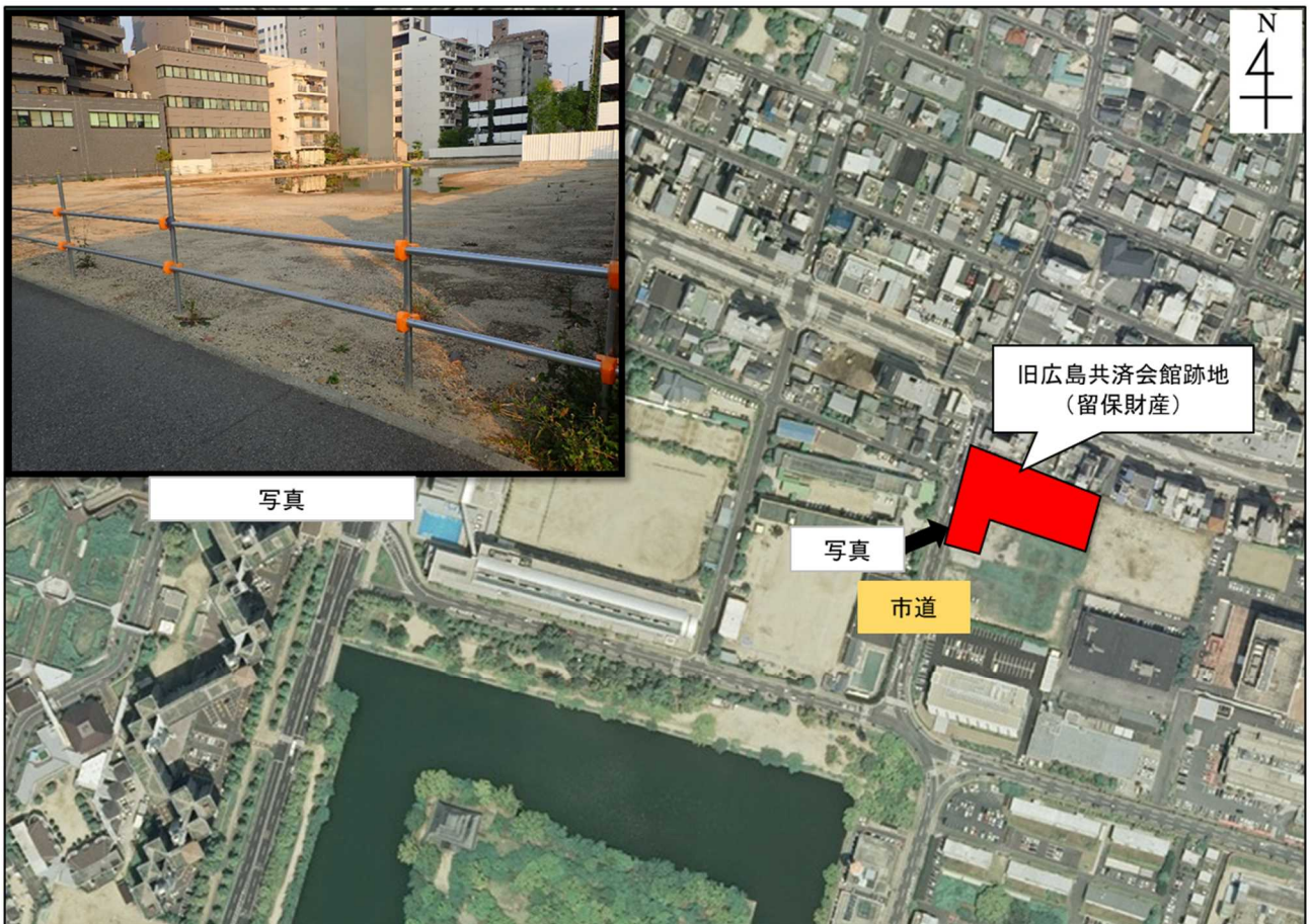
「空中写真データ」(国土地理院HP : http://maps.gsi.go.jp/ ) をもとに中国財務局作成