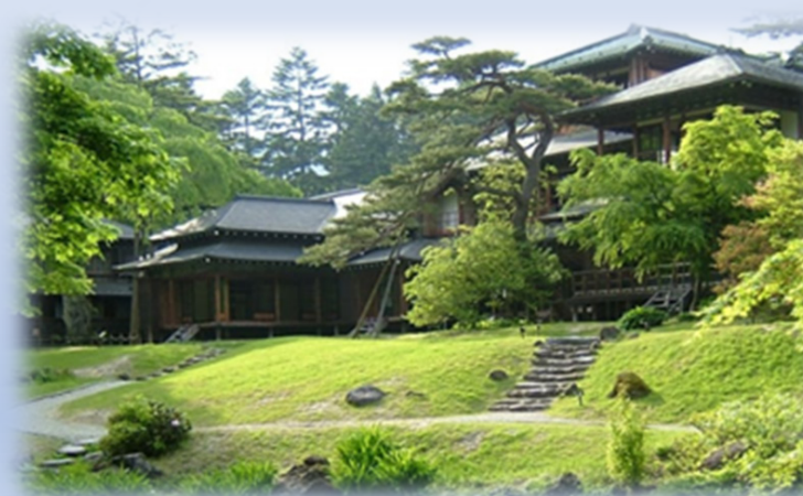
「国有財産」の活用 (田母沢御用邸記念公園 日光市)

○国の庁舎跡地などの国有地は、公的利用を優先に、県や市町に売却や貸付を行い、公園などの公的施設としての活用を図っています。