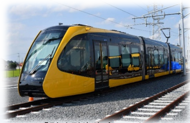
「財政融資資金」の活用 芳賀・宇都宮LRT

○地方公共団体に対し、財務健全化に資するアドバイスのため、 財務状況の把握 を行っています。