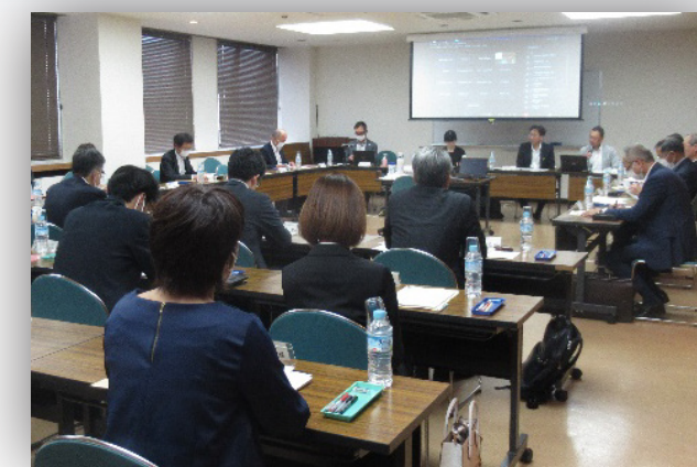
(栃木活性化サロン)

○国の将来を担う小・中・高校生、子育て世代の方等を対象にした 財政や金融に関する講義、広報活動 に取り組んでいます。