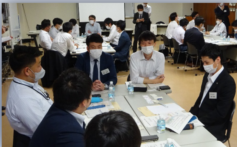
(県内信金・信組若手渉外担当者等 による意見交換会)

○ 金融サービス利用者の保護 の観点から、金融機関等が適切な業務運営を行っているかを監督しています。