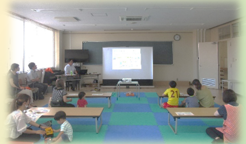
(子育て世代向けマネー講座)