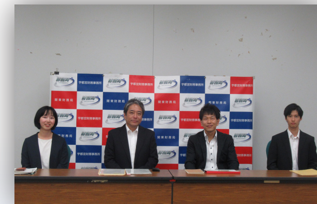
(県内経済情勢報告記者発表)

○定期的にラジオに出演し、宇都宮財務事務所の業務や取り組み、財務省又は金融庁の施策の中から、 身近な話題を発信 しています。