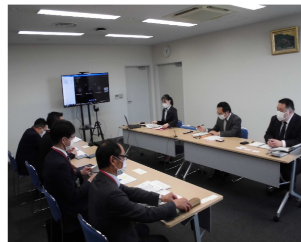
金融監督業務 （金融機関とのヒアリング）