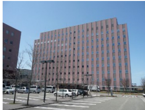
新潟財務事務所（新潟美咲合同庁舎2号館）

このほかにも、財務省・金融庁の諸施策を地域の皆さんに伝えるとともに、県内の経済情勢等を把握し、国の各種政策の企画・立案に反映させるなど、国と地域社会を結ぶ重要な役割を果たしています。