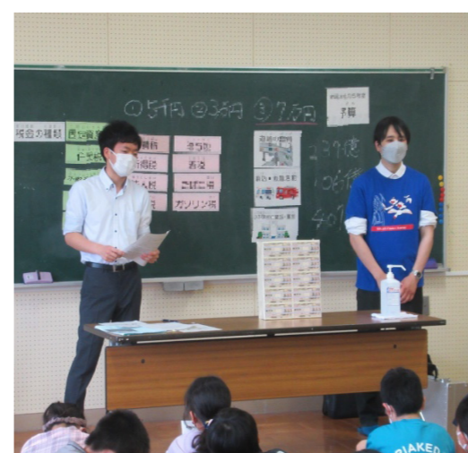
財政に関する授業の様子