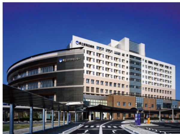
新潟県立新発田病院（新発田市）

県や市町村等が学校、病院の建設や上・下水道、社会福祉施設等の整備をするときなどに資金が必要となった際には、国が財政融資資金の貸付けを行っており、地域住民の豊かで住みよい社会環境の整備に貢献しています。