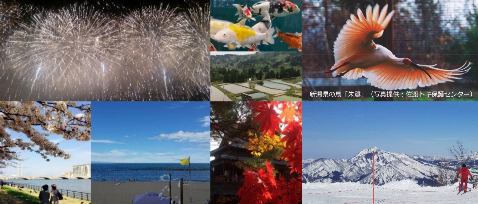
新潟県の鳥「朱鷺」